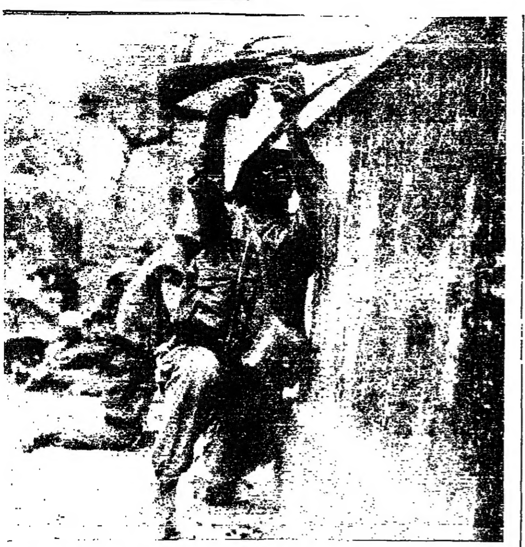
أكثر أملاً... ان يرفع الجندي المصري ريشته ويخضع راسه وهو يبتلع اثار على نوار الصنوبر في جنينته...